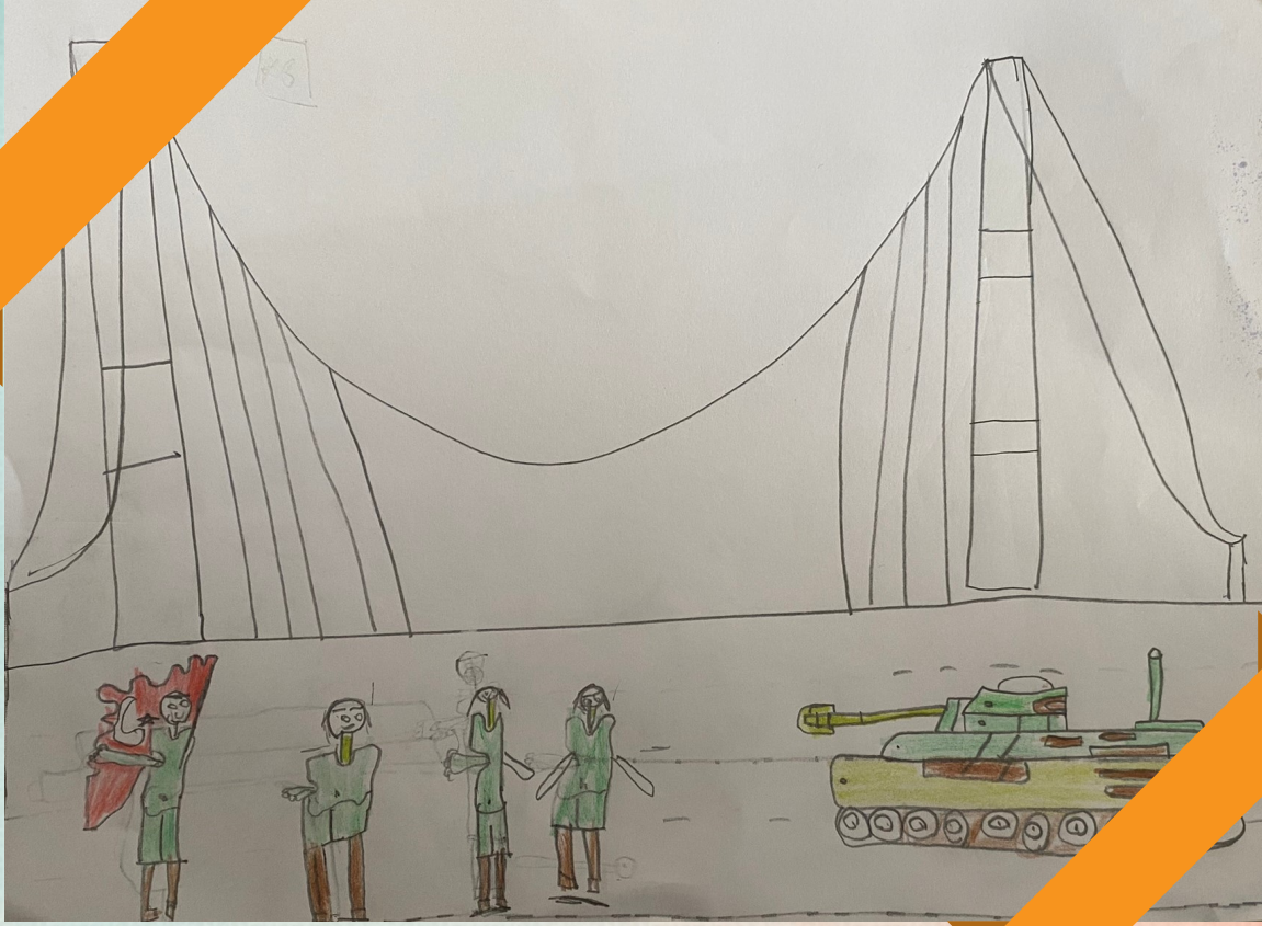
YASİN ORTA- 2/A